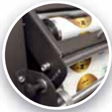
Ayarlanabilir web debriyajı