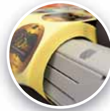
Doğru geri sarma