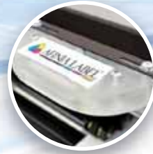
Yeni optik sensör