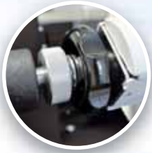
Rulo boşalma frenleyicisi