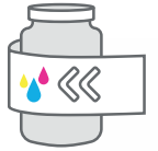
Bas ve uygula